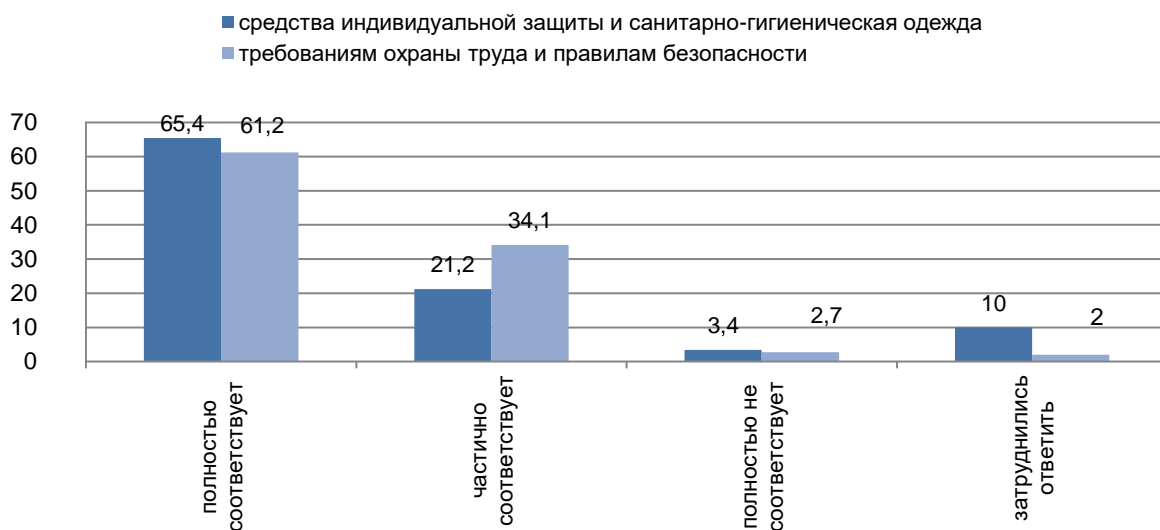
Рисунок 4 – Оценка соответствия условий труда требованиям охраны труда и правилам безопасности

Картина соответствия условий труда требованиям охраны труда и правилам безопасности также выглядит благоприятно. Вариант «полностью соответствует» выбрало большинство опрошенных (61,2 %), «частично соответствует» – 34,1 %, «полностью не соответствует» – 2,7 % респондентов. Затруднились с оценкой 2 % молодых рабочих (рисунок 4).