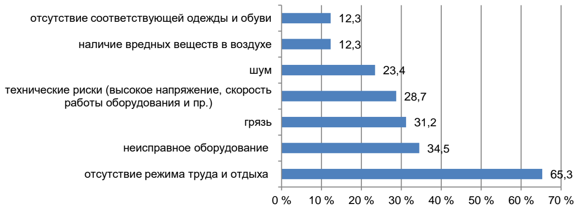
Рисунок 1 – Факторы, негативно влияющие на здоровье, %