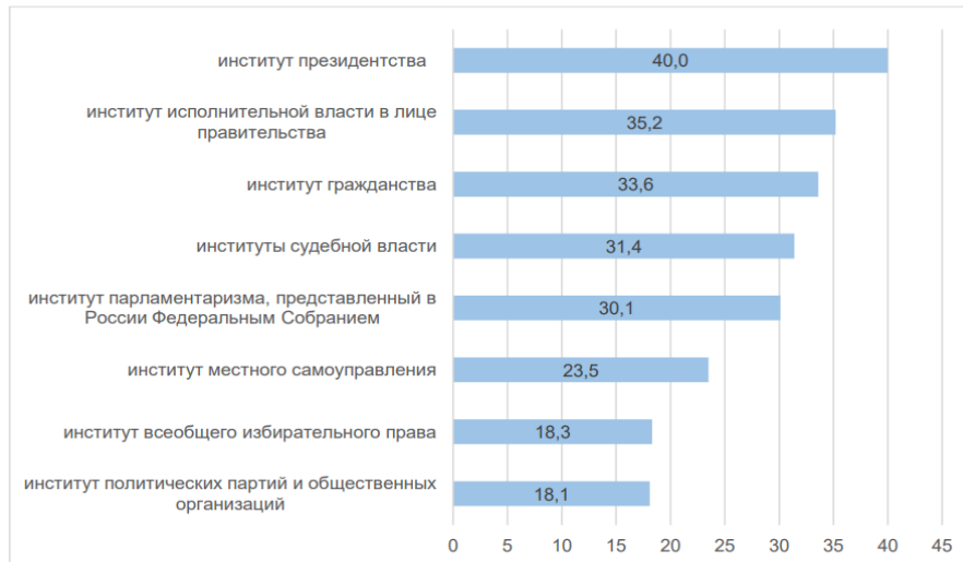
Рисунок 2 – Какие политические институты, на Ваш взгляд, играют ключевую роль в решении политических вопросов внутри нашей страны?,

Данные выводы подтверждаются и ответом на вопрос о нынешней роли различных институтов в решении политических вопросов внутри страны (Рисунок 2). Лишь по мнению 18 % учащейся молодежи, институт всеобщего избирательного права и институт политических партий и общественных организаций играют существенную роль во внутриполитическом процессе страны.