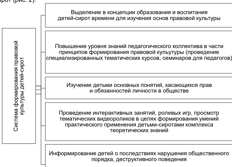
Рисунок 2 – Составляющие компоненты системы формирования правовой культуры детей-сирот

Исходя из вышеуказанного, одним из ключевых принципов формирования правовой культуры детей-сирот выступает последовательность, взаимодействие и комплексность в реализации всей педагогической системой правового воспитания личности. На основании теоретического анализа литературы нами была разработана система формирования правовой культуры детей-сирот (рис. 2).