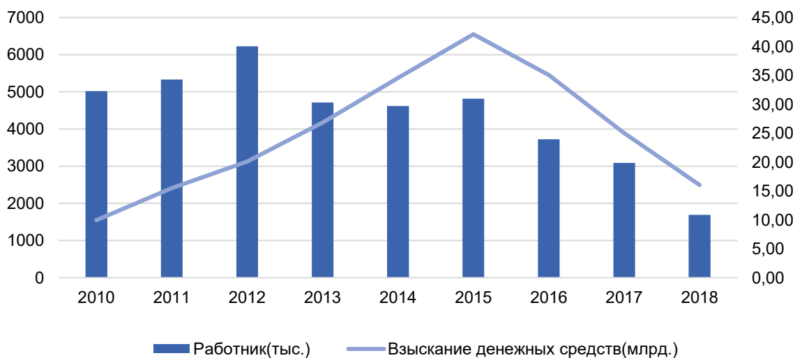
Рисунок 1 – Динамика государственного регулирования своевременных выплат заработной платы представителям социальной группы сельских трудящихся-мигрантов [5]

Сельские трудящиеся-мигранты действительно представляют собой большую социальную группу и являются важной частью современного китайского общества, которую нельзя игнорировать. Согласно статистическим данным на конец 2018 г. общее количество сельских трудящихся-мигрантов в Китае составляло 288,36 млн человек, из которых 172,66 млн работали в крупных городах [4]. В целом число «крестьянских рабочих», перед которыми у предприятий есть задолженность по заработной плате, довольно велико, причем в последние три года наблюдений роль государства в процессе ее взыскания заметно снизилась (рис. 1).