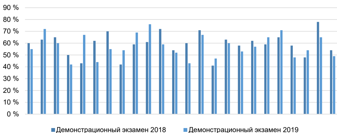
Рисунок 2 – Итоговый балл за демонстрационный экзамен

Результаты опытно-экспериментальной работы показали, что новая форма аттестации, представляющая собой совокупность традиционного экзамена и конкурсного задания World Skills, обладает как достоинствами, так и недостатками. К достоинствам можно отнести следующие положения.