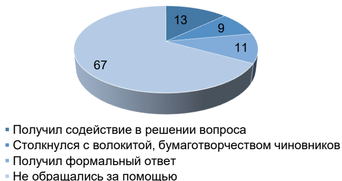
Рисунок 3 – Оценка степени эффективности обращения в органы власти на региональном уровне

Примечательно оценка молодежью опыта ее взаимодействия с государственными органами. По оценке респондентов, лишь 13 % обращений молодых людей было услышано, а 20 % столкнулись с бюрократией и решения не получили (рис. 3).