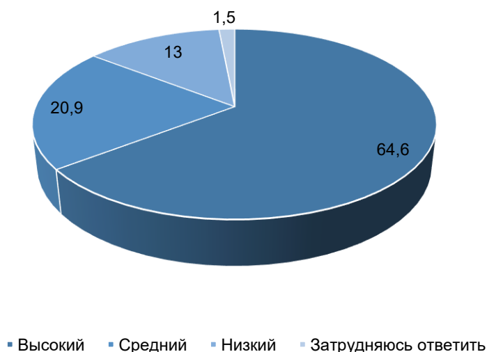
Рисунок 4 – Оценка молодыми респондентами уровня коррупции

Значимым фактором, влияющим на формирование образа государства в глазах молодежи, является успешная борьба с коррупцией. 64,6 % опрошенных считают, что уровень коррупции в России – высокий, 20,9 % – средний, 1,5 % – низкий, 13 % – затруднились ответить (рис. 4). То есть в целом усилия, предпринимаемые для борьбы с коррупционными преступлениями, считаются неэффективными.