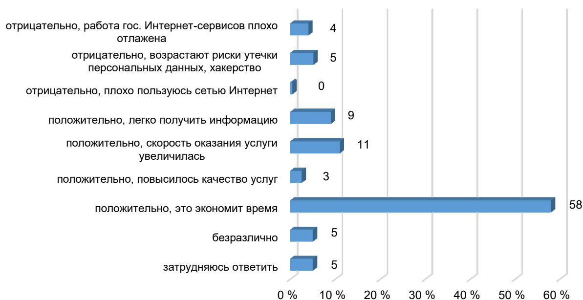
Рисунок 5 – Отношение молодежи к внедрению программы «электронного правительства»

Молодые люди поддерживают программу по внедрению «электронного правительства»: положительно о ней высказалось 80,5 % опрошенных (рис. 5).