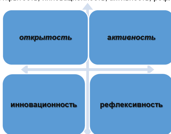
Рисунок 2 – Принципы обучения в экстремальных условиях онлайн- или дистанционного формата

В новых условиях индивидуальная деятельность студентов становится центральной в процессе освоения программы высшего образования. Дистанционное обучение предусматривает более активное взаимодействие с преподавателем, чем традиционное. В целом оно должно учитывать несколько принципов, получивших применительно к удаленному формату взаимодействия новое звучание: открытость, инновационность, активность, рефлексивность (рис. 2).