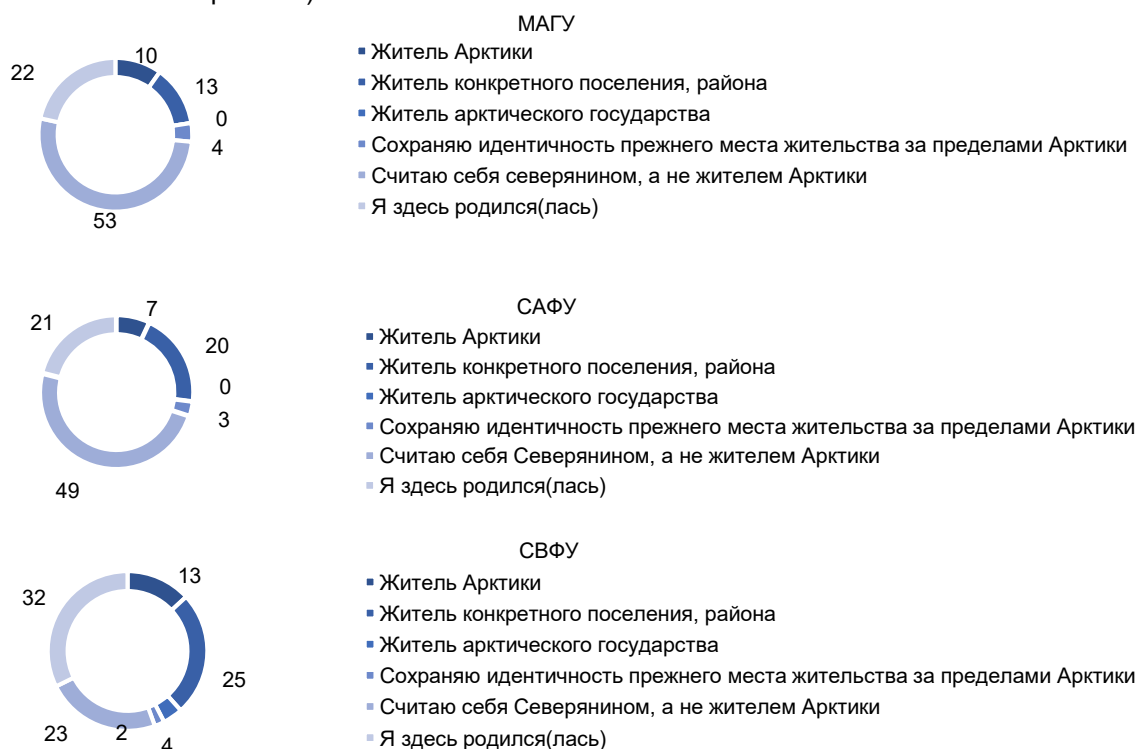
Рисунок 3 – Распределение ответов на вопрос «Кем Вы себя считаете по территориальной принадлежности?», %

На главный вопрос анкеты «Кем Вы себя считаете по территориальной принадлежности?» однозначного ответа у большинства нет, мнения студентов сосредоточились вокруг трех вариантов (рисунок 3). Выбор представителей МАГУ и САФУ практически идентичен: половина обучающихся считают себя «северянином, а не жителем Арктики» (53 и 49 % опрошенных соответственно). Подобную позицию занимают 23 % участников исследования из СВФУ, из них 6 % – выходцы из арктических районов Якутии. 32 % студентов этого вуза предпочли ответ «я здесь родился», из них 7 % – жители арктических районов Якутии (это самый частый вариант – 28 %, как и ответ «житель Арктики»).