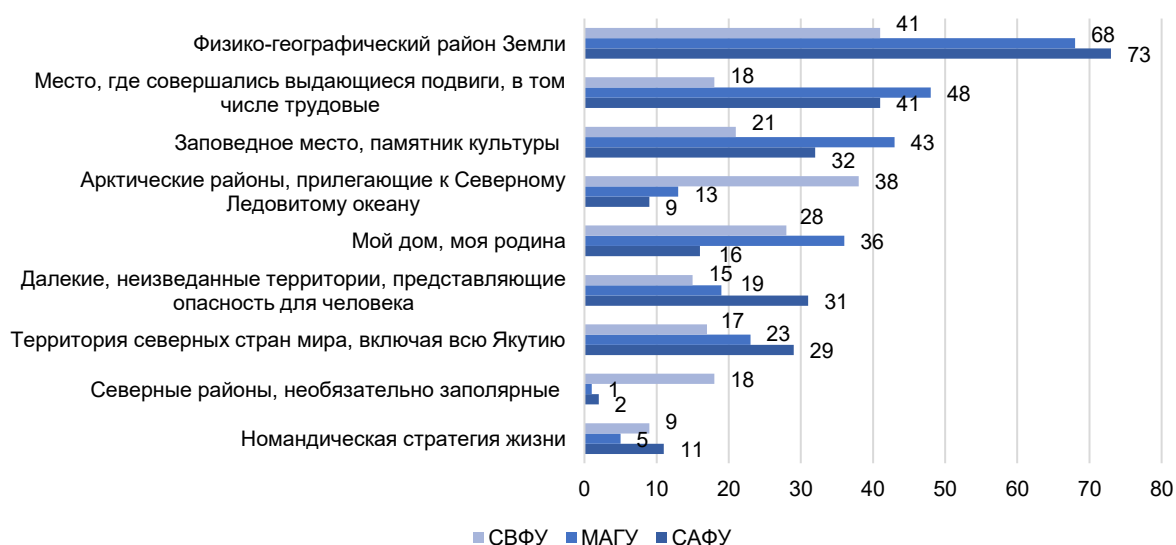
Рисунок 2 – Распределение ответов на вопрос «Ваше основное восприятие Арктики», %

Особенности отношения студентов к региону проявились в ответах на вопрос анкеты «Ваше основное восприятие Арктики» (рисунок 2). Здесь также варианты, выбранные обучающимися СВФУ, отличались от ответов представителей МАГУ и САФУ.