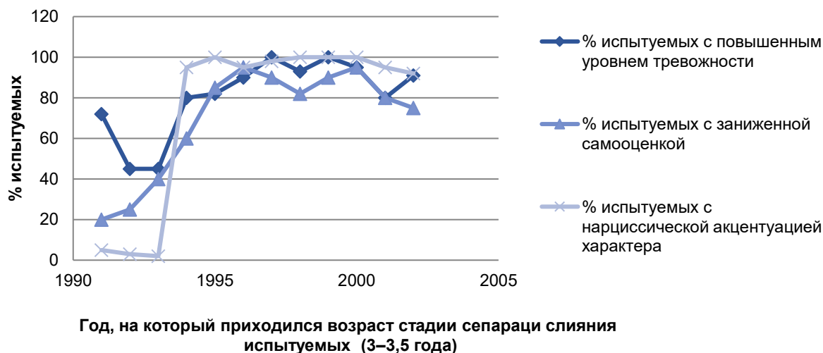
Рисунок 1 – Зависимость между годом и процентом испытуемых

В ходе проводимого обследования, помимо процента выявленной нарциссической акцентуации характера среди обучающихся, исследовался уровень тревожности и уровень самооценки. Характерно, что эгоцентризм и заниженная самооценка сосуществовали в испытуемых, что дополнительно свидетельствует о росте числа невротических личностей (К. Хорни) [12]. Если 2006–2010 гг. характеризовались относительно низкими процентами количества лиц с нарциссической акцентуацией характера (2–5 %), то 2011–2019 гг. показывают лавинообразный рост числа до 92–100 %. Зависимость между годом, на который приходился возраст стадии сепарации слияния испытуемых, и процентом испытуемых, проявивших отдельные личностные характеристики представлена на рис. 1.