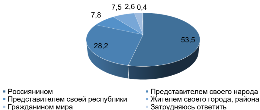
Рисунок 2 – Иерархия идентичностей в системе ценностей респондентов (Кем Вы себя ощущаете, прежде всего?), %

При выстраивании иерархии идентичностей у представителей северокавказских Республик (РСО – Алания, КБР и РД) была зафиксирована приоритетность общегражданской идентичности – 53,5 % – по отношению к остальным видам идентичностей (рис. 2). Естественно, что при анализе полученных данных мы учитывали тот факт, что опрос проводился в Республиках, которые имеют полиэтничную структуру общества, поэтому вполне возможно, что полученные данные как раз и являются следствием полиэтничности данных субъектов СКФО. Более чем вероятно, что в моноэтничных субъектах СКФО иерархический ряд привлекательных для индивида идентичностей может иметь совершенно иную структуру.