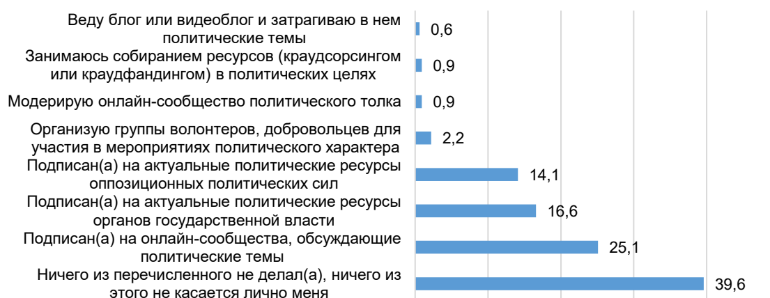
Рисунок 1 – Распределение ответов на вопрос: «Укажите, что из нижеперечисленного характеризует лично Вас и Ваше поведение в сети Интернет, что из нижеперечисленного лично Вы делаете онлайн?», %

ресурсы оппозиционных политических сил (14,1 %). 39,6 % опрошенных ничего из перечисленного не делали (рисунок 1).