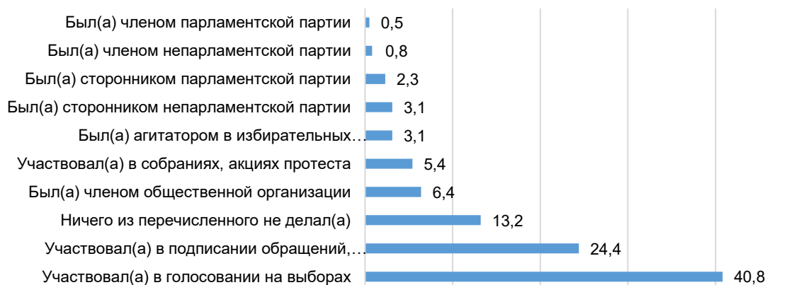
Рисунок 2 – Распределение ответов на вопрос: «Что из нижеперечисленного лично Вы делали в реальной жизни?», %

Отвечая на вопрос: «Что из нижеперечисленного лично Вы делали в реальной жизни?», большинство респондентов отмечают, что участвовали в голосовании на выборах (40,8 %) и подписывали обращения, петиции (24,4 %). Участниками собраний и акций протеста были 5,4 % респондентов (рисунок 2).