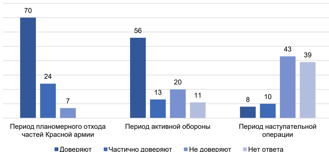
Рисунок 1 – Распределение ответов на вопрос «Верите ли Вы Гитлеру?», %

Так как опросы военнопленных носили регулярный характер, специалистам политотдела Северо-Западного фронта удалось представить их результаты в динамике в зависимости от одного из трех периодов ведения боевых действий: планомерного отхода советских войск (N = 47), активной обороны (N = 81), наступательной операции частей Красной армии (N = 198) [20]. Сравнение полученных данных позволяет проследить, как менялось настроение и уровень доверия Гитлеру среди солдат вермахта, участвовавших в боях на территории Советского Союза (рис. 1).