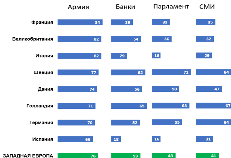
Рисунок 2 – Уровень доверия населения стран Западной Европы основным социальным институтам, %

Исследования, проведенные Pew Research Center в 2018 г., позволяют сделать вывод, что уровень доверия населения к вооруженным силам в странах Западной Европы значительно превышает уровень доверия к другим государственным и общественным институтам (рисунок 2) [7].