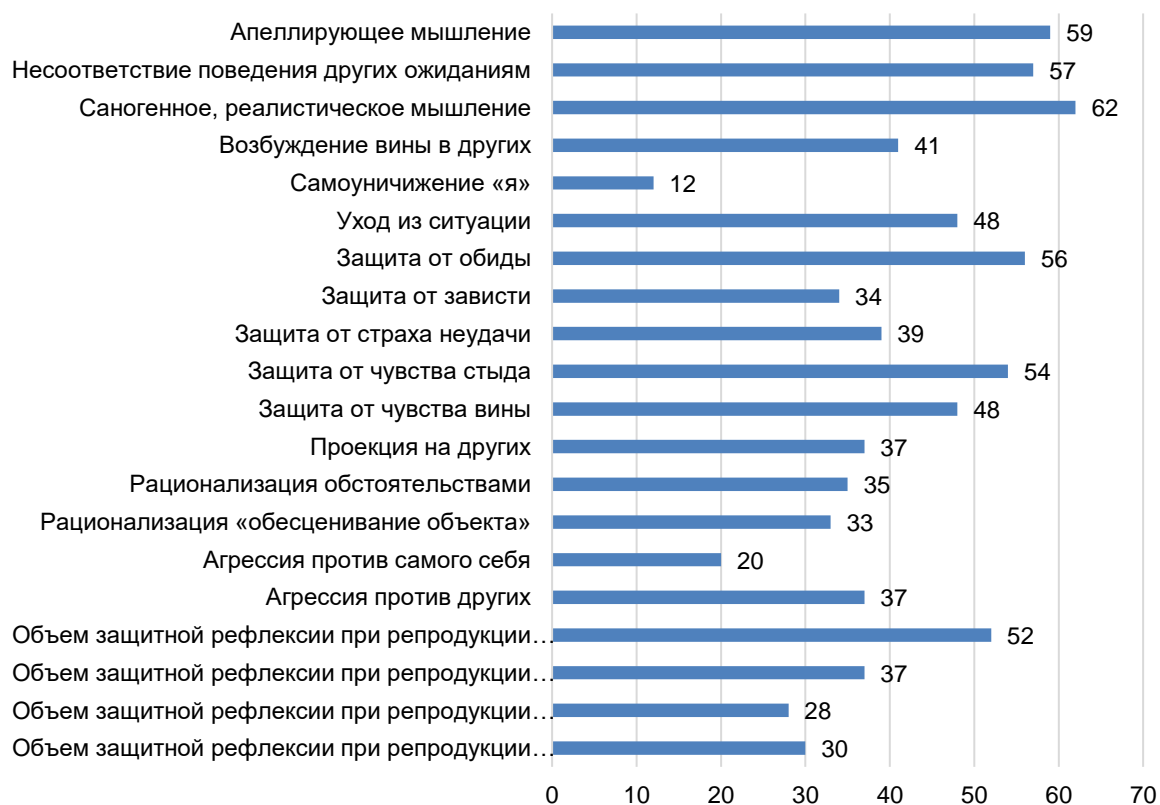
Рисунок 1 – Общий результат КЭТ среди представителей творческих профессий

Результаты по методике КЭТ представлены на рисунке 1.