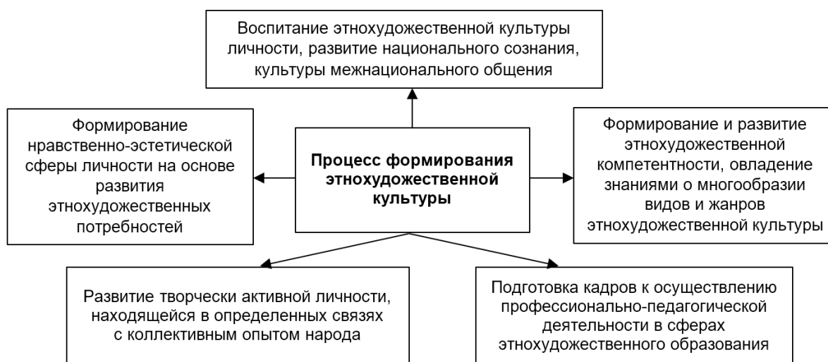
Рисунок 2 – Процесс формирования этнохудожественной культуры личности

Процесс формирования этнохудожественной культуры личности включает в себя ряд этапов, представленных на рисунке 2.