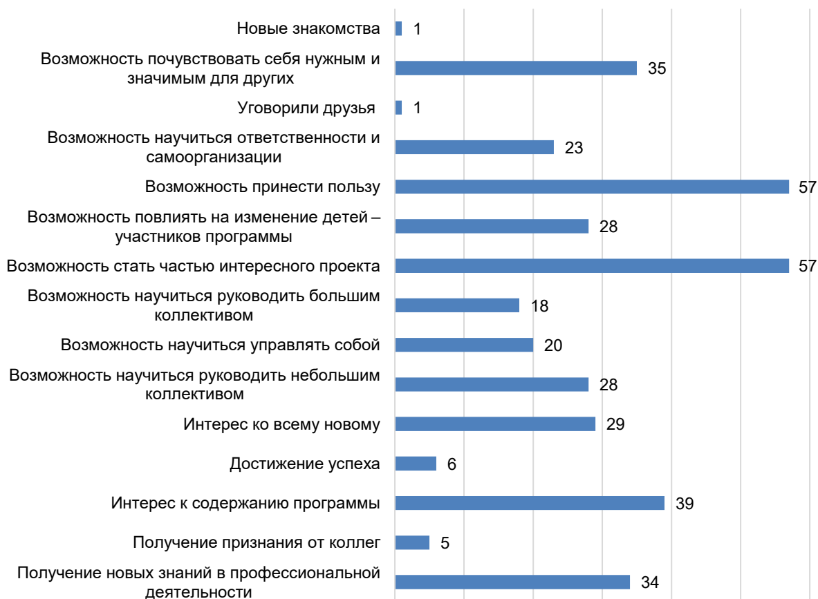
Рисунок 1 – Определяющие мотивы участия респондентов в проекте «Адаптационный лагерь для первокурсников» в качестве организаторов, %

Мотивы, выделенные респондентами, можно условно разделить на несколько групп. Альтруистические – возможность почувствовать себя нужным и значимым для других – 35 %, возможность принести пользу – 57; мотивы личного развития – возможность стать частью интересного проекта – 57, интерес к содержанию программы – 39, интерес ко всему новому – 29, получение новых знаний в профессиональной деятельности – 34, возможность научиться ответственности и самоорганизации – 23, научиться руководить большим коллективом – 18, научиться управлять собой – 20, возможность научиться руководить небольшим коллективом – 28; мотивы общения – уговорили друзья – 1, новые знакомства – 1 %.