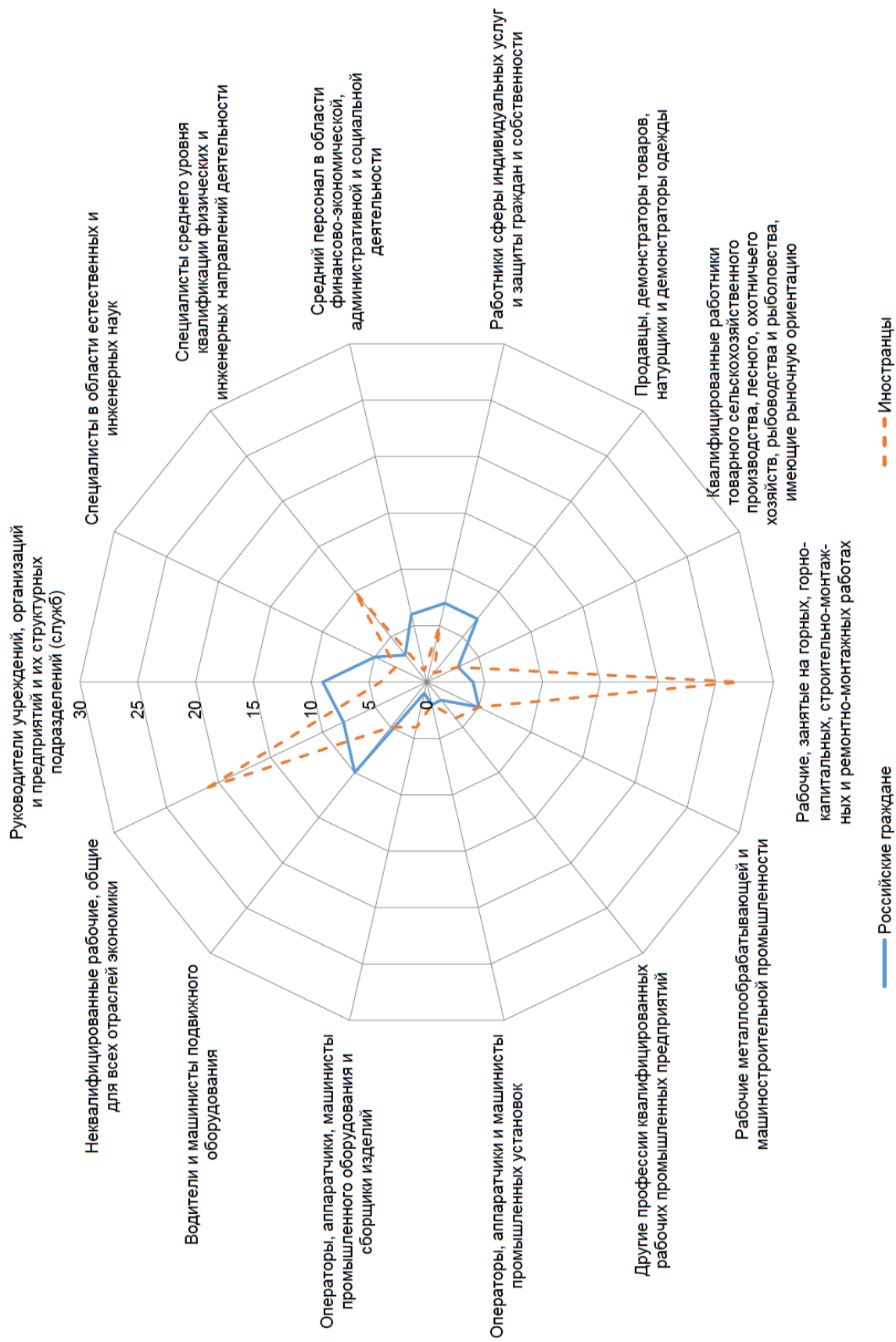
Рисунок 3 – Структура занятости российских граждан и иностранных граждан по некоторым профессиональным группам в 2014 г., % [14]