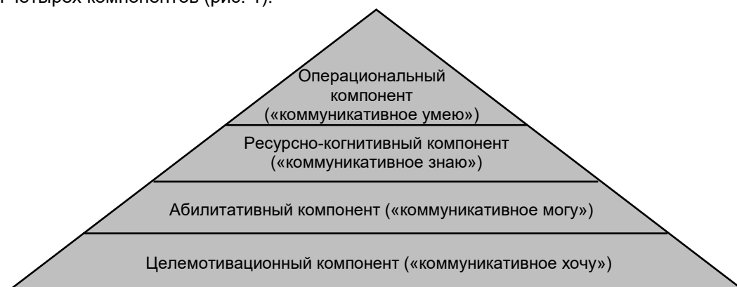
Рисунок 1 – Трансакционная модель коммуникативной личности (по Д.П. Гавре)

коммуникативной личности. Данная модель рассматривает структуру коммуникационной личности, состоящую из двух подсистем: внутренней (подсознание и сознание) и внешней (поведения). Актуализация этих подсистем происходит в конкретной ситуации через коммуникативное действие, и, согласно Д.П. Гавре, совокупность характеристик этих подсистем проявляется посредством четырех компонентов (рис. 1).