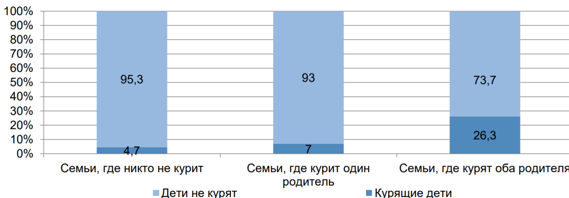
Рисунок 1 – Влияние курения родителей на формирование табачной зависимости у детей, %