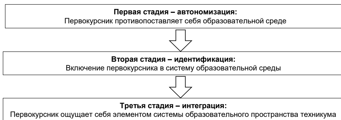
Рисунок 2 – Стадии адаптации первокурсников

Для создания условий успешной адаптации первокурсников к образовательному процессу техникума нами выявлены наиболее типичные проблемы, с которыми сталкивается большинство студентов в первый год обучения, и причины их возникновения.