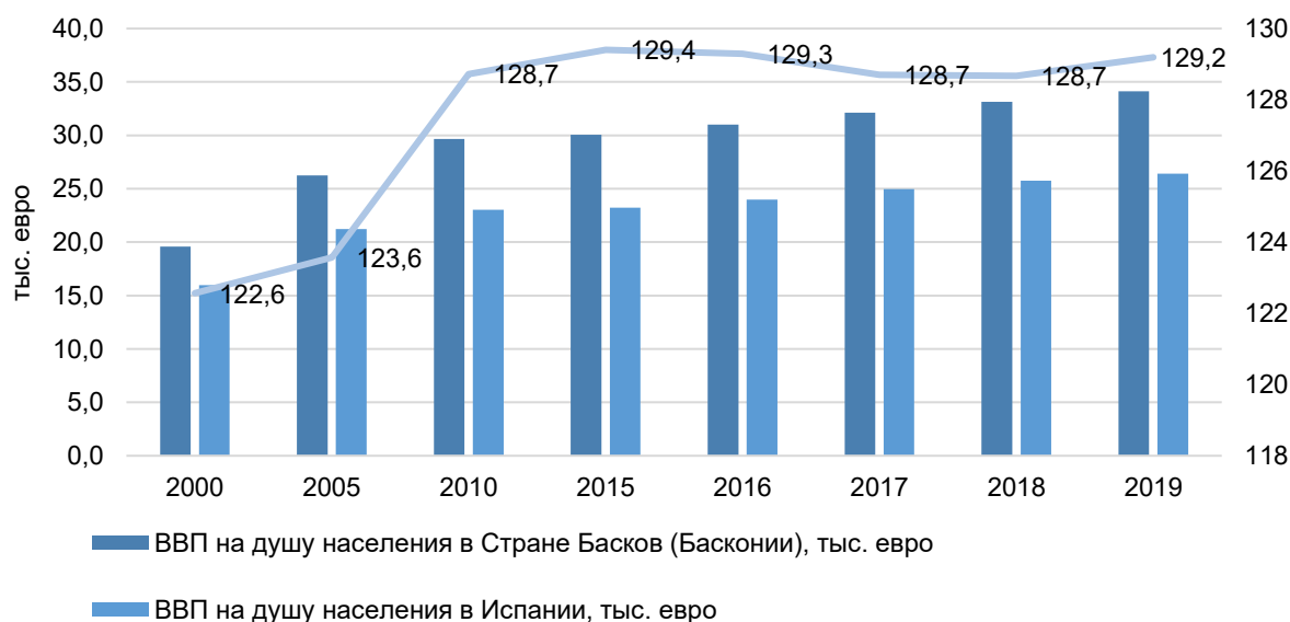
Рисунок 2 – Соотношение уровня ВВП на душу населения в Стране Басков и Испании в 2000–2019 гг., %

Как показывает анализ данных в динамике, уровень межрегиональных различий в рассматриваемом срезе начал усиливаться с 2004 г. К 2019 г. ВВП на душу населения в Басконии превышал средний ВВП на душу населения в Испании на 29,2 % (рис. 2).