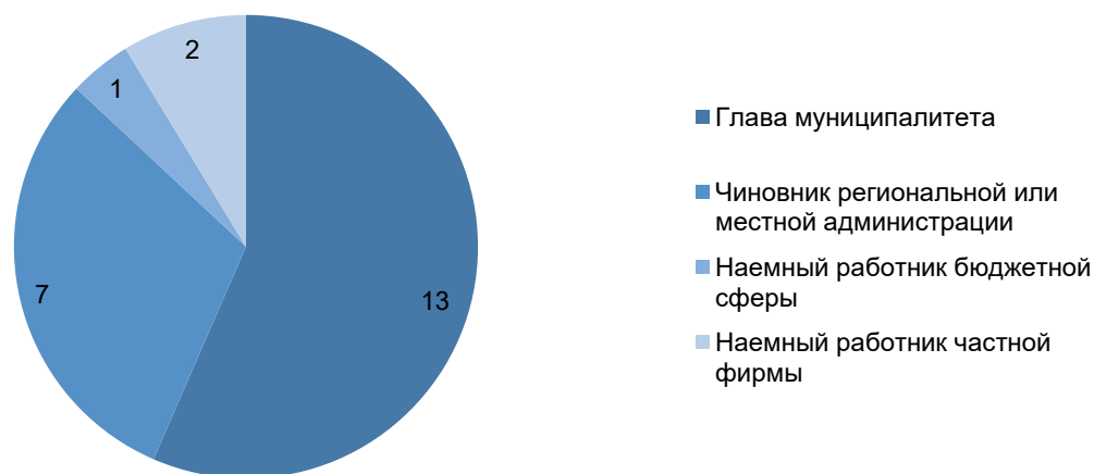
Рисунок 3 – Род занятий кандидатов на пост мэра непосредственно перед избранием

Общее представление об этом можно получить из рис. 3 и 4.