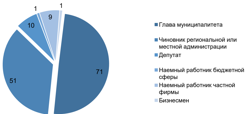
Рисунок 4 – Род занятий кандидатов на пост мэра непосредственно перед назначением