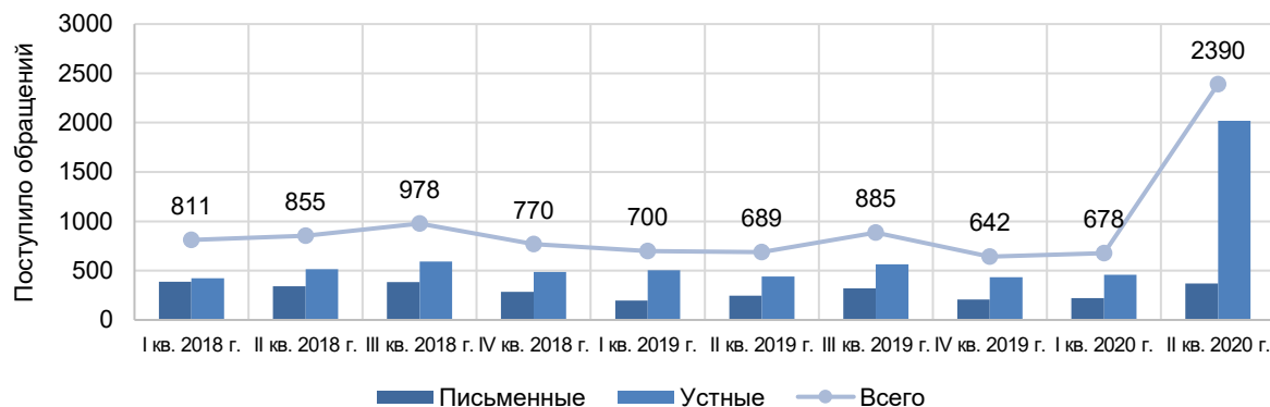
Рисунок 2 – Динамика количества обращений граждан, поступивших в администрацию муниципального образования Тихорецкий район

Динамика количества обращений граждан, поступивших в администрацию муниципального образования Тихорецкий район, представлена на рисунке 2.