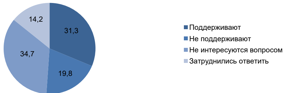
Рисунок 2 – Отношение населения страны к идее создания на Украине поместной автокефальной церкви, % [14]