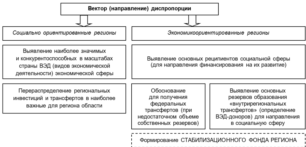
Рисунок 1 – Основные направления стратегии региона в зависимости от существующего вектора развития и коэффициента жизненности региона