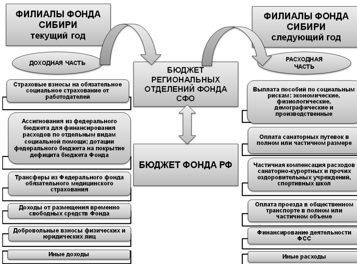
Рисунок 2 – Структура функционирования бюджета Фонда социального страхования Сибири [7]