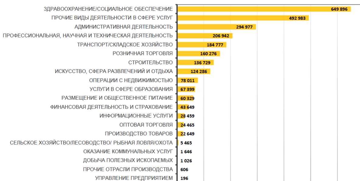
Рисунок 2 – Общее число компаний, принадлежащих чернокожим гражданам США, по отраслям

По результатам исследований, основанных на данных опросов представителей малого бизнеса, в ряде американских штатов существуют благоприятные условия для развития бизнеса афроамериканцев [13]: