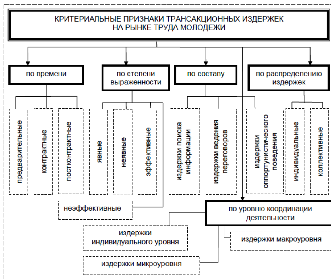
Рисунок 1 – Особенности критериальных признаков транзакционных издержек на рынке труда молодежи [3]

На рисунке 1 представлены наиболее значимые критериальные признаки транзакционных издержек и их разновидности с учетом ординалистского подхода, позволяющего упорядочить данные издержки без их количественного определения [2, с. 108], а также оценить уровень их влияния на молодежный рынок труда республики.