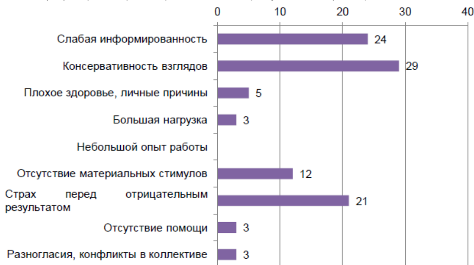
Рисунок 2 – Причины сопротивления нововведениям персонала ООО «БелМеталл»

Далее мы проанализировали возможные причины сопротивления персонала нововведениям (рисунок 2). Основными из них являются слабая информированность (24 %), консервативность взглядов (29), страх перед отрицательным результатом (21 %).