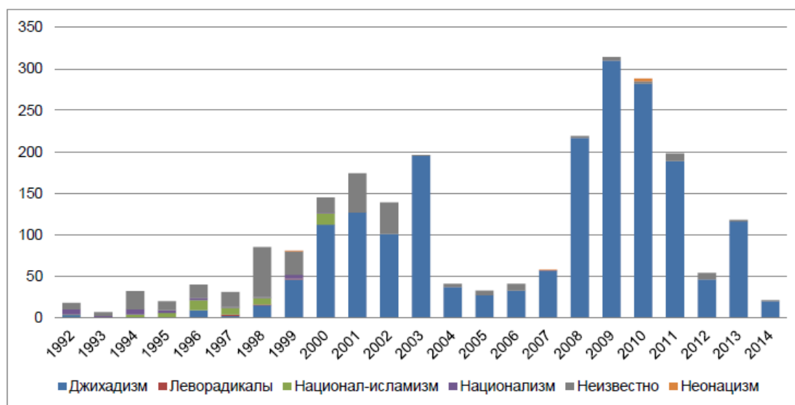
Рисунок 3 – Динамика идеологических ориентиров субъектов террористической активности в России, 1992–2014 гг. (по количеству акций) *

Анализ идеологических основ терроризма на постсоветском пространстве демонстрирует их значительные метаморфозы. Если в начале – середине 1990-х угроза наибольшей степени исходила от националистических (этносепаратистских) группировок, то уже ко второй половине десятилетия основным вызовом системе безопасности стал джихадистский терроризм (см. рис. 3). При этом подобные тенденции, отмечающиеся на территории постсоветского пространства, повторяют глобальные тенденции, фиксируемые исследователями на протяжении достаточно продолжительного периода времени [17].