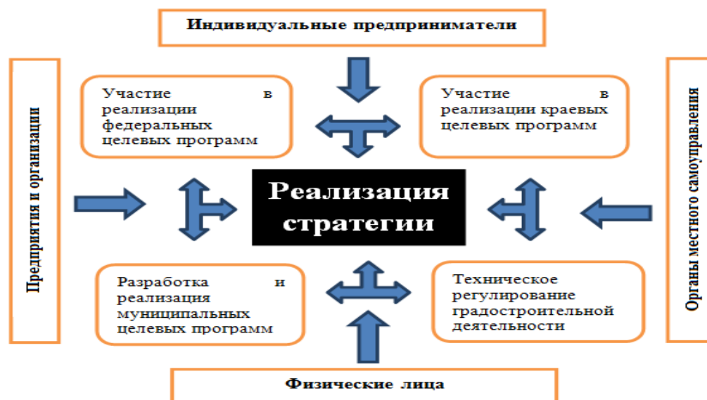
Рисунок 2 – Схема реализации стратегии социально-экономического развития МО Кореновский район на период до 2020 г. (разработано авторами по [13])

Для улучшения предпринимательского климата, повышения инвестиционной привлекательности и поддержки малого и среднего предпринимательства Кореновского района в 2008 г. была разработана стратегия социально-экономического развития МО Кореновский район на период до 2020 г., схема реализации которой представлена на рис. 2.