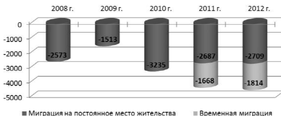
График 4 – Динамика миграционной убыли населения за 2008–2012 гг., чел.

Ежегодно увеличивается численность прибывающих в Республику Бурятия из других стран и регионов России (внешняя миграция). За 2012 г. численность прибывших в Республику Бурятия увеличилась на 4815 человек и составила 11 333 человека. Также увеличилась численность выбывших граждан на 2138 человек и составила 15 856 человек. Общая миграционная убыль составила в 2012 г. 4523 человека, в том числе 2709 человек – выбывших на постоянное место жительства (график 4).