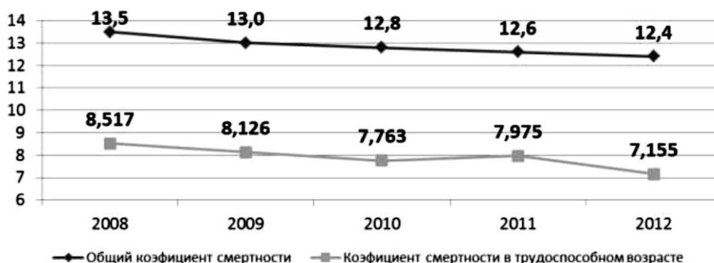
График 3 – Динамика коэффициентов смертности, на 1000 чел.

В 2008–2012 гг. в Республике Бурятия наблюдается положительная динамика снижения смертности населения, в том числе в трудоспособном возрасте (см. график 3).