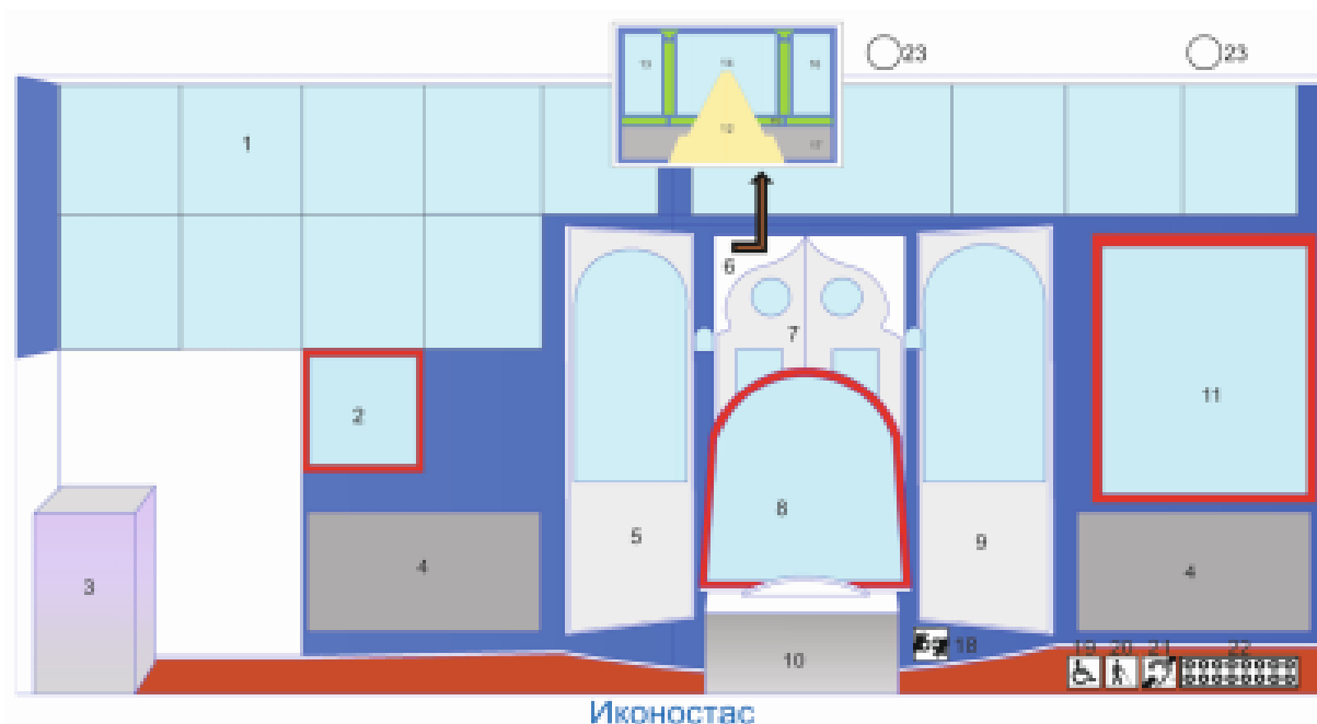
Рисунок 2 – Дизайн-проект современного больничного храма для людей с ОВЗ:

1 – праздничный ряд; 2 – икона свт. Пантелеимона; 3 – канун; 4 – полотенца; 5 – северные врата; 6 – алтарь; 7 – царские врата; 8 – икона «Спас в силах»; 9 – южные врата; 10 – аналой; 11 – храмовая икона Божией Матери «Казанская»; 12 – престол; 13 – образ свт. Тихона Задонского; 14 – образ Христа Вседержителя, Матери Божией и Иоанна Крестителя; 15 – орнамент; 16 – образ сщмч. Уара Липецкого; 17 – полотенца; 18 – сурдопереводчик; 19 – инвалид-колясочник; 20 – слабослышащие люди; 21 – слабослышащие люди; 22 – тактильное напольное покрытие; 23 – аудиодуш.