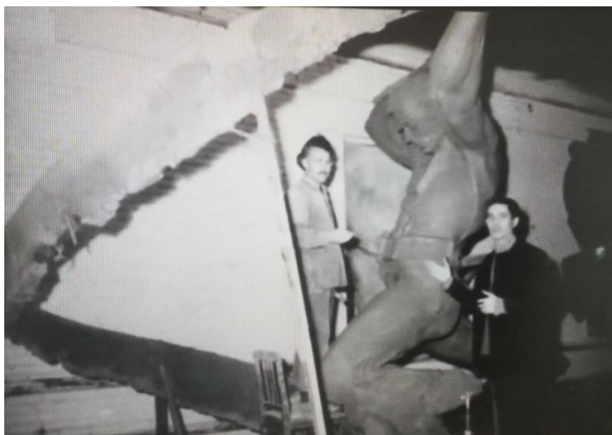
Рисунок 1 – В мастерской скульптора. Работа над памятником «Пожарным»

Среди многих творений особо примечателен памятник «Пожарным». Именно это произведение принесло его автору широкую славу (рисунок 1). Установленный в ноябре 1968 г. на ул. Индустриальной г. Грозного, памятник стал известен в Чехословакии, Румынии, Венгрии и других странах социалистического лагеря как произведение, посвященное героическому подвигу работников тыла во время Великой Отечественной войны. Памятник, ставший одним из символов города, был сооружен в честь его защитников, отразивших в 1942 г. налеты фашистской авиации и погибших во время тушения пожаров нефтяных промыслов. Ингушский скульптор-монументалист смог передать напряжение сил и накал борьбы сражавшихся с огнем. Основу скульптурной композиции составляет полубнаженный мужчина, сгибающийся в могучих руках железнодорожный рельс. Он нависает над фашистской бомбой, накрывает ее, пытаясь согнуть рельс до конца.