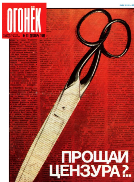
Рисунок 2 – Обложка журнала «Огонёк», декабрь 1989 г. [5]

Анализ современного законодательства показывает, что с точки зрения государственной политики дети и подростки становятся полноценными участниками медиaproстранства. Это накладывает на государство дополнительную ответственность за формирование у них информационной грамотности и прагматичного, взвешенного отношения к получаемой информации.