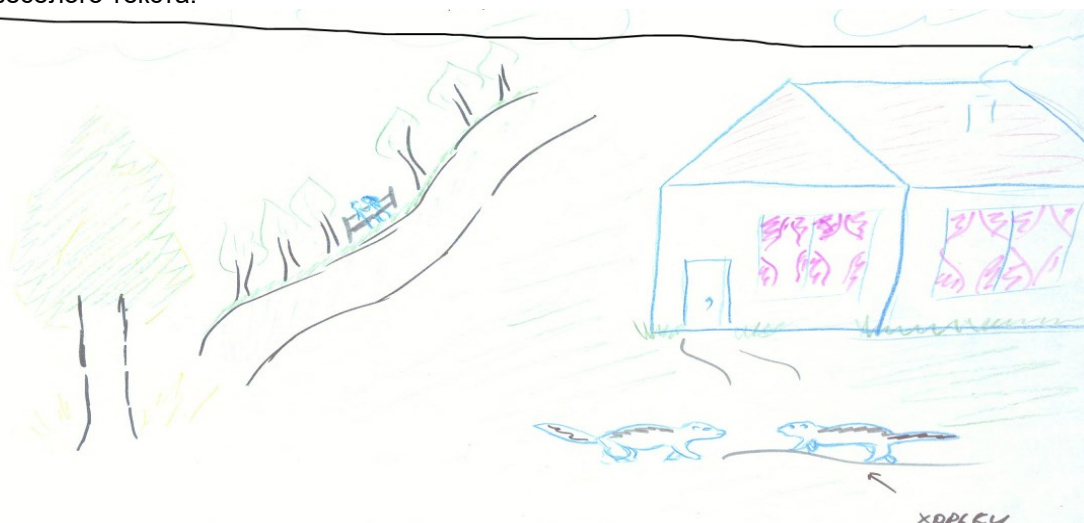
Рисунок 4 – Графическая картина мира активного интернет-пользователя (непосредственное окружение)

В сочинении девушка начинает свой рассказ с будущего и уделяет ему особое внимание, описывая и изображая свой мир веселым, ярким и насыщенным позитивными эмоциями. При психолингвистическом анализе жизненной истории студентки явно прослеживаются характеристики веселого текста.