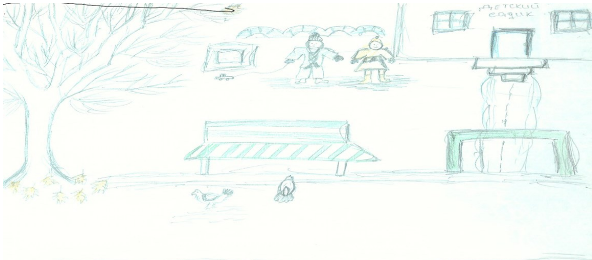
Рисунок 3 – Графическая картина мира ситуативного интернет-пользователя (пейзажная)

В описании своего образа жизни с направленностью на настоящее девушка раскрывает двойственное видение окружающего мира. На это указывают слова: «На данный момент окружающий мир для меня составляют деньги, обман, ложь, выгода и лесть – это основа существования людей!» При анализе жизненной истории явно прослеживаются характеристики темного текста, в его основе лежит описание восприятия мира студенткой, который окружает ее. «Я» выступает как субъект жизнедеятельности и получает такие предикаты: «темный», «лживый», «смерть». При написании сочинения студентка использует глаголы настоящего времени, что свидетельствует о направленности на настоящее.