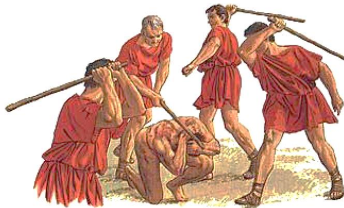
Рисунок 3 – Децимация в армии Древнего Рима

В Древнем Риме появился такой вид наказания, как децимация, который представлял собой казнь каждого десятого воина легиона или армии в наказание за бегство с поля боя, сдачу крепости, трусость или невыполнение приказа (рис. 3).