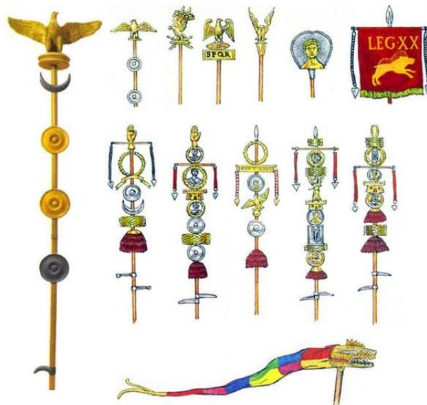
Рисунок 4 – Воинские знаки римских легионов

В древнеримском войске начали появляться специальные воинские знаки различия, которые постоянно эволюционировали (рис. 4). Так, первоначально символом пехоты и конницы служил пучок сена, привязанный к наконечнику копья, затем это был вид человеческой кисти, а в период поздней Римской республики знаком легиона стал римский одноглавый золотой или серебряный орел (аквила), закрепленный на вершине древка.