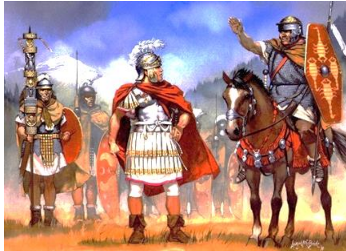
Рисунок 2 – Приветствие древнеримского военачальника

Армия римских легионов, приветствуя военачальника, использовала жест, который применяли гладиаторы по отношению к Цезарю. Так, при произнесении фразы « Ave, Caesar, morituri te salutant » («Здравствуй, цезарь! Идущие на смерть приветствуют тебя») гладиаторы резко вскидывали прямые правые руки вертикально вверх или под углом по отношению к земле (рис. 2). Демонстрация свободной правой руки доказывала императору, что мужчина не прячет оружия, которое может нанести вред правителю. Данное этикетное действие получило название «римский салют», происходящее от латинского salutant – ‘приветствие’.