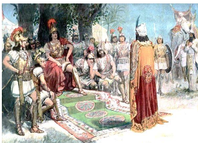
Рисунок 1 – Древнеримский военачальник

Во-первых, старшинство древнеримских начальников должна была подчеркивать форма одежды как атрибут воинского этикета (рис. 1). Все начальствующие лица, за исключением полководцев, носили удлиненные плащи белого цвета. (Рядовой воин носил короткий плащ рыжеватого цвета.) Предводители армий носили длинные плащи пурпурного цвета с бахромой.