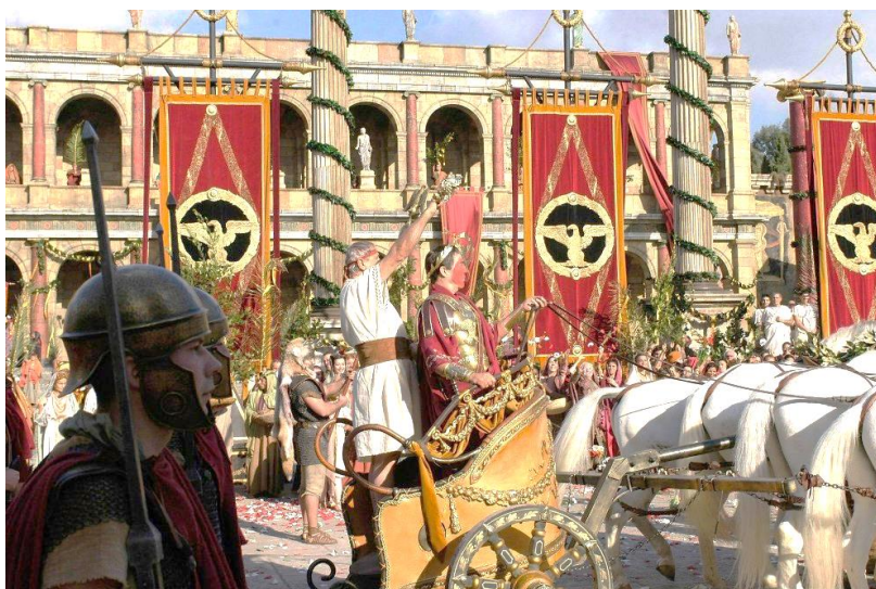
Рисунок 6 – Триумф в Древнем Риме (реконструкция)

Но самыми почетными наградами были большие или малые триумфы , представлявшие собой чествования полководцев за битвы или победы над неприятелем, в ходе которых ими было уничтожено более 10 тыс. человек (рис. 6). Малый триумф отличался от большого тем, что триумфатор въезжал в Рим один на коне, без войска.