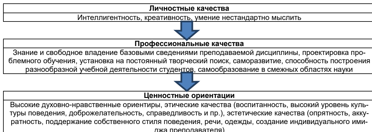
Рисунок 1 – Характеристика личности преподавателя современной высшей школы

Таким образом, современный педагог вуза – это личность, обладающая рядом уникальных характеристик, например умением мыслить и подавать свою мысль нестандартно, творчески, креативно и др. Представим характеристику личности педагога в виде схемы (рис. 1).