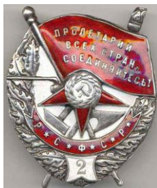
Рисунок 6 – Орден «Красное Знамя» образца 1918 г.

Начало наградной системе первого в мире государства рабочих и крестьян положил Декрет ВЦИК от 16 сентября 1918 г. об учреждении первого ордена Республики Советов – ордена «Красное Знамя» (рис. 6). В Декрете указывалось, что данный знак отличия присуждался всем гражданам Российской Социалистической Федеративной Советской Республики, проявившим особую храбрость и мужество при непосредственной боевой деятельности. Учреждение ордена имело огромное воспитательное значение. В памятке, выдаваемой награжденному орденом «Красное Знамя», говорилось: «Тот, кто носит на груди этот высокий пролетарский знак отличия, должен знать, что он из среды равных себе выделен волею трудящихся масс как достойный и наилучший из них» [7, с. 34].