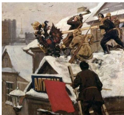
Рисунок 1 – Долой царского орла! (картина И. Владимирова)

События октября 1917 г. положили начало новому этапу отечественной истории, названному советским, в ходе которого были созданы принципиально новые экономические, социально-политические и идеологические устои общества (рис. 1). Для защиты первого в мире социалистического государства была создана новая армия, получившая название Рабоче-крестьянской. Для ее успешного развития и функционирования стала формироваться новая система воспитания бойцов, одним из элементов которой были правила и нормы воинского этикета. Следует отметить, что становление и развитие советского воинского этикета носило сложный, противоречивый, а порою и драматический характер.