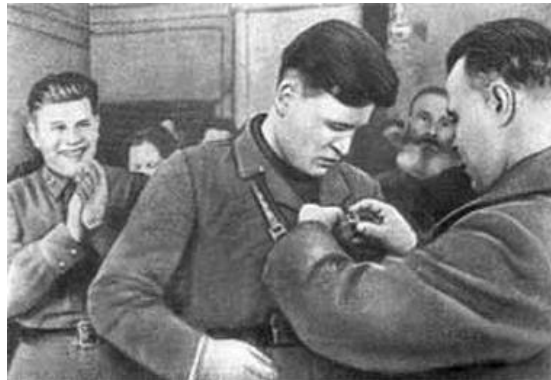
Рисунок 8 – Ритуал вручения Золотой Звезды Героя Советского Союза

В 1934 г. советским правительством была установлена высшая степень отличия – звание Героя Советского Союза. Данное звание присваивалось гражданам, совершившим выдающийся героический подвиг во славу Родины. Позднее для лиц, удостоенных этой высшей степени отличия, был учрежден особый знак – медаль «Золотая Звезда» (рис. 8).