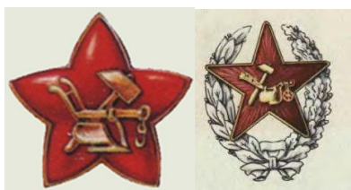
Рисунок 4 – Кокарда на головной убор и нагрудный знак РККА образца 1918 г.

Большое внимание со стороны советского правительства уделялось разработке новых знаков различия как важных атрибутов воинского этикета. Так, в Красной армии для определения принадлежности к ее составу в 1918 г. был установлен нагрудный знак в виде венка из лавровых и дубовых веток, поверх которого располагалась пятиконечная красная звезда, покрытая красной эмалью. В центре звезды помещалась эмблема в виде плуга и молота. В этом же году учрежден значок-кокарда для головных уборов командиров и красноармейцев, представляющий собой пятиконечную звезду с молотом и плугом в виде эмблемы посередине. На воротниках шинелей и гимнастерок стали помещаться петлицы цвета, соответствующего роду войск.