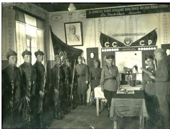
Рисунок 3 – Прием формулы торжественного обещания красноармейцами

Процесс смены правил воинского этикета царской армии на этикетные нормы социалистической армии проходил весьма быстро и решительно. Этому способствовали: с одной стороны, несоответствие воинского этикета и его атрибуты (знаки различия и отличия, форма одежды и др.) императорской армии требованиям времени и «запросам» вновь созданной Красной армии; с другой стороны, необходимость разработки и внедрения принципиально новых знаков различия, символики, формы одежды, правил взаимоотношений в новой армии, которые бы с успехом противостояли старой символике, носимой белогвардейскими частями.