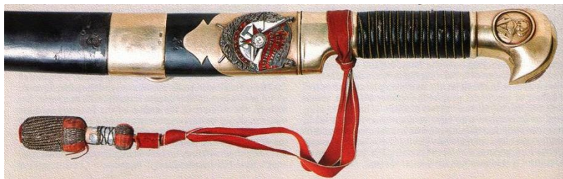
Рисунок 7 – Почетное революционное оружие

В годы Гражданской войны появилась еще одна награда – почетное революционное оружие (рис. 7), учрежденное Декретом ВЦИК РСФСР от 8 апреля 1920 г. Оно стало наследником Георгиевского оружия, существовавшего в Русской армии. Им удостоивались лица высшего командного состава Рабоче-крестьянской Красной армии за особые боевые отличия. Почетное революционное оружие представляло собой шашку (кортик) с вызолоченным эфесом и прикрепленным к нему знаком ордена Красного Знамени.