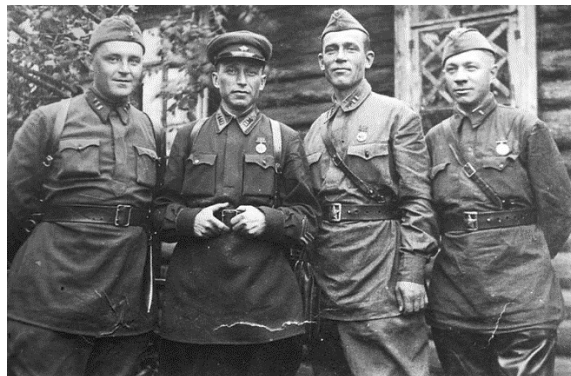
Рисунок 5 – Красные командиры

При военной форме не полагалось носить ничего, кроме планшета, полевой сумки (как неотъемлемой части обмундирования) или в крайнем случае портфеля. Это правило также позволяло сохранять выправку и внешнее достоинство [6, с. 188].